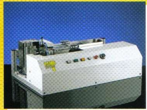
· 自動銘牌送料系統